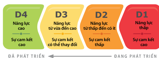
Các cấp độ phát triển